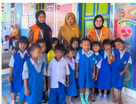
Gambar 2. Sesi Foto Bersama

Secara keseluruhan, hasil kegiatan menunjukkan bahwa mendongeng interaktif adalah cara yang efektif untuk memupuk prinsip anti-bullying pada anak usia dini. Anak-anak tidak hanya memperoleh pemahaman tentang apa yang dimaksud dengan perilaku baik dan buruk, tetapi mereka juga melakukan perubahan dalam interaksi sosial mereka sehari-hari. Anak-anak secara alami menanamkan nilai anti-bullying melalui pengalaman emosional, penguatan positif, dan keterlibatan aktif. Dengan demikian, kegiatan ini menunjukkan bahwa pendekatan pendidikan karakter yang didasarkan pada cerita dan pengalaman sosial dapat menjadi solusi preventif untuk mengurangi perilaku agresif sejak usia dini dan membangun budaya empati.