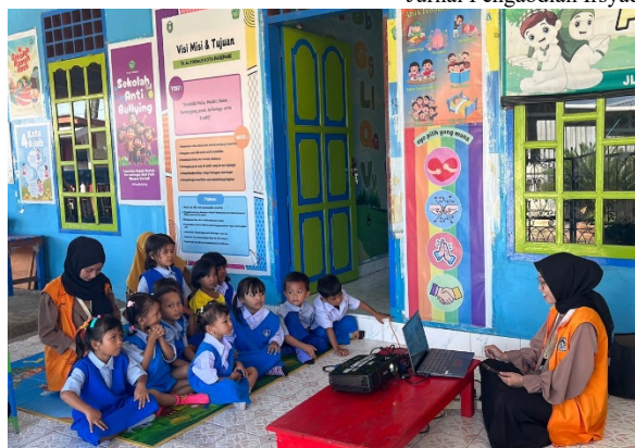
Gambar 2. Kegiatan Mendongeng